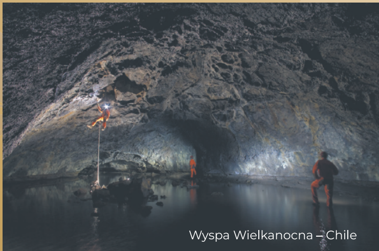
Wyspa Wielkanocna – Chile